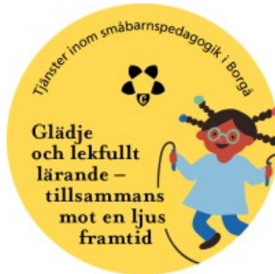
Bild 1. Visionen för tjänster inom småbarnspedagogik i Borgå 2026–2030. (Bildillustration Maija Blomqvist)

"Inom tjänsterna för småbarnspedagogik i Borgå stad bygger vi en god vardag tillsammans. Våra styrdokument samt stadens värderingar, mål och tyngdpunktsområden visar riktningen för vårt arbete."