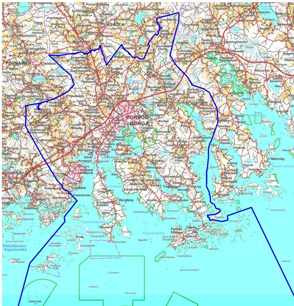
Bild 1 Karta över Borgå stad

Enligt markanvändnings- och bygglagens (i fortsättningen MarkByggL) 15 § när byggnadsordningen bereds skall i tillämpliga delar iakttas vad som bestäms om växelverkan.