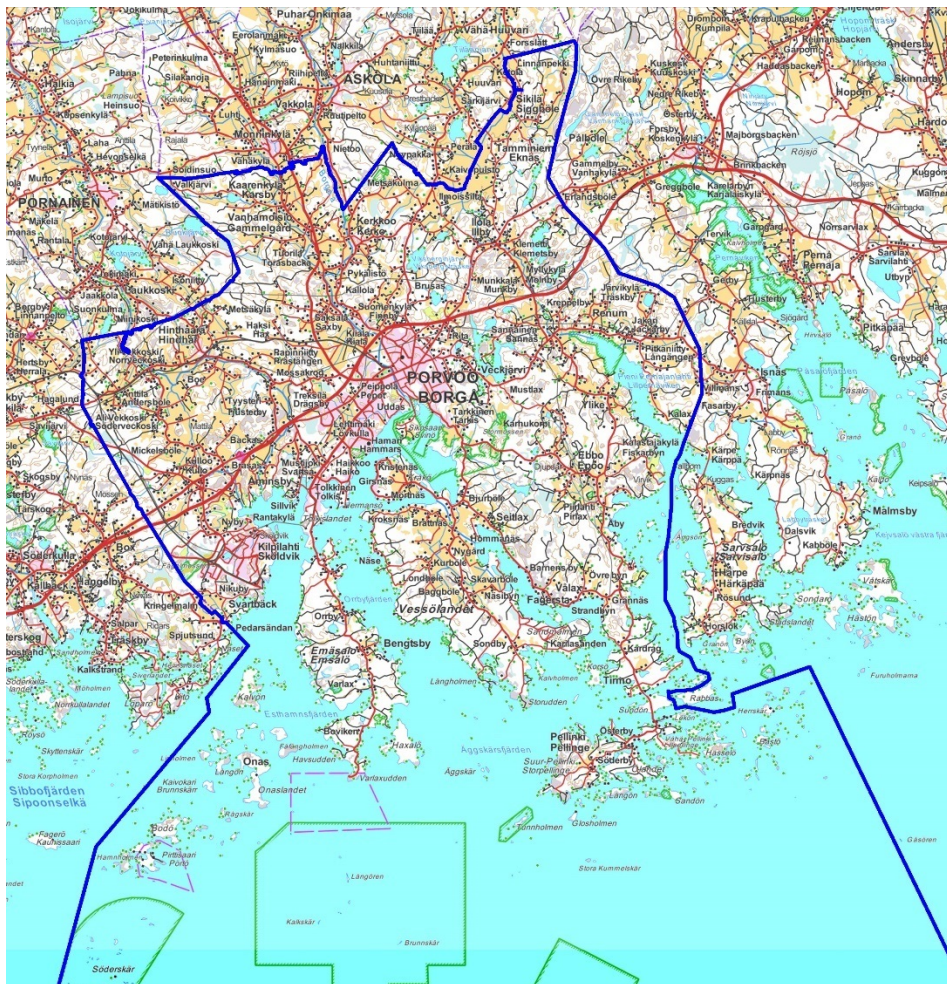
Kuva 1 Porvoon kaupungin kartta

Maankäyttö- ja rakennuslain (jatkossa MRL) 15§ mukaan rakennusjärjestyksen valmistelussa on sovellettava soveltuvilta osin kaavojen valmistelussa käytettävää vuorovaikutusmenettelyä.