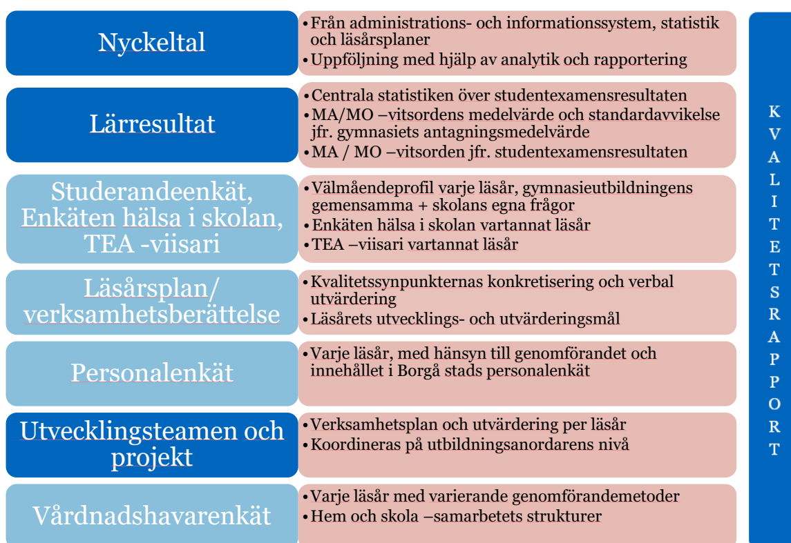
Figur: Komponenter i gymnasieutbildningens kvalitetsutvärdering

Kvalitetsarbetet utförs både på utbildningsanordnarens nivå samt på läroanstaltsnivå. Styrgruppen för kvalitetshantering ansvarar för utbildningsanordnarens kvalitetsutvärdering. Utvärderingsmaterial samlas av kvalitetskoordinator enligt nedan beskrivet schema. Årligen publiceras en kvalitetsrapport, en sammanfattning av utvärderingsmaterial från gymnasierna.