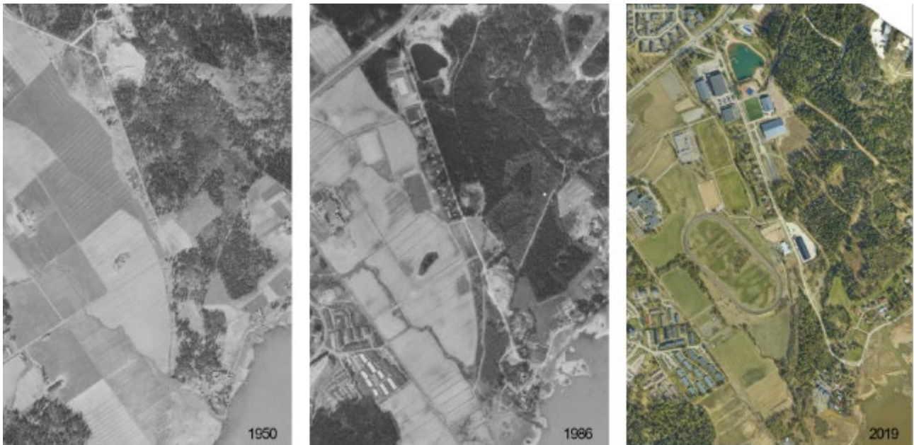
Kuva 5. Ortoilmakuvat vuosilta 1950, 1986 ja 2019. Kuvat eivät ole mittakaavassa. Vuoden 1950 kuvassa nähdään alu- een pohjoisosassa soranottoalueita, jolle ei ole vielä muodostunut pohjavesiallasta. Lapinniementie on olemassa, mutta pientalorivistö on vasta rakentumassa. Vuoden 1986 kuvassa nähdään jo maauimala, Kokonhalli ja jäähallin kohdalla ollut tekojäärata. Vuoden 2019 tilanne vastaa tämän hetken toteutustilannetta lukuun ottamatta alueen länsipuolella erot- tuvaa väistöpäiväkotia, joka on nyttemmin purettu.

Tolkkistentien pohjoispuolella vastapäätä liikuntakeskuksen ydinaluetta on Peippolankolmion asuin- alue, jossa on monipuolista asuinrakennuskantaa pienehköistä kerrostaloista omakotitaloihin. Peip- polankolmion rakennukset ovat pitkälti ajalta 2004 - 2014.