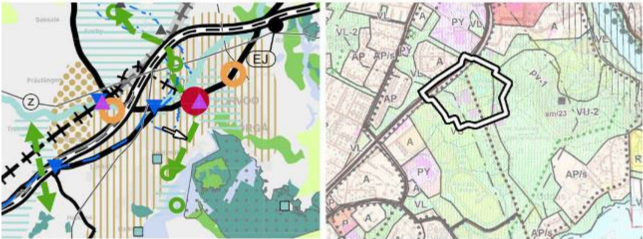
.Kuva 2. Alueen sijainti maakuntakaavayhdistelmässä ja yleiskaavassa. Ei mittakaavassa. Huom, luonnosvaiheen rajaus.

Keskeisten alueiden osayleiskaavassa (hyväksytty 15.12.2004) suunnittelualue on urheilu- ja virkistyspalvelujen aluetta (VU). Aivan alueen itäosa on osa urheilu- ja virkistyspalvelujen aluetta, jolla on erityisiä ympäristöarvoja (VU-2). Jääkiekkotien–Lapinniementien linjausta myötäilee kevyen liikenteen reitti -merkinä. Tolkkistentie on osoitettu seututieksi/pääkaduksi ja sitä myötäilee kevyen liikenteen reitti. Yleiskaavassa rakennettu alue on pohjavesialuerajauksen (tärkeä pohjavesialue, pv-1) sisällä. Sittemmin pohjavesialueen rajausta on tarkennettu. Vuoden 2019 luokitusmuutoksen mukaisesti alueen luoteisosassa Tolkkistentien eteläosan pohjoispuolella oleva alue on luokiteltu muuksi vedenhankintakäyttöön soveltuvaksi pohjavesialueeksi ja Tolkkistentien ajoradan pohjoisreunan pohjoispuolella oleva alue on jo vedenhankintaa varten tärkeää pohjavesialuetta.