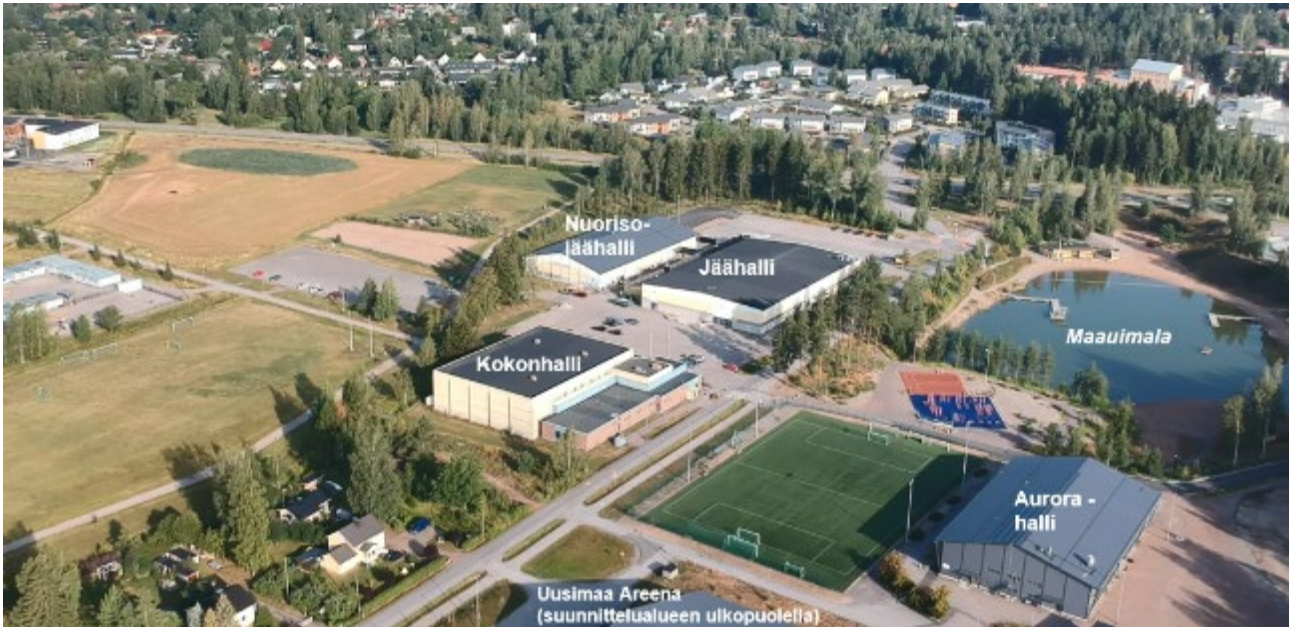
Kuva 4. Alueen rakennuskanta ilmakuvasa selittävin tekstein. Ilmakuva, ote videosta 8.8.2019.

Alueella on neljä urheilutoimintaa palvelevaa rakennusta, maauimalan palvelurakennus ja muutamia pienempiä maauimalaa palvelevia pukusuoja. Lisäksi ns. Aurorahallin liepeillä on aputilarakennelmia.